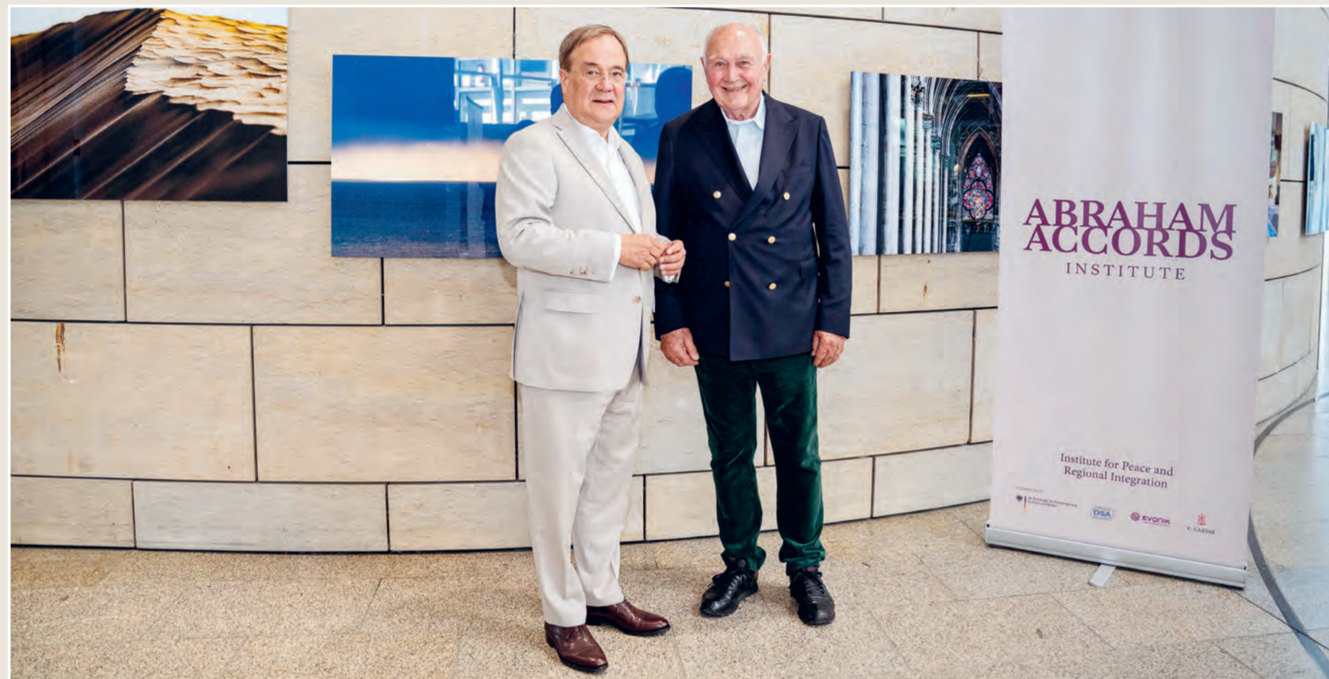
Armin Laschet und Hans-Günther Kaufmann

Das Projekt wurde in enger Zusammenarbeit mit dem Abraham Accords Institute initiiert, einem 2022 von Armin Laschet gegründeten Institut, das sich für Frieden, regionale Integration und interreligiösen Dialog zwischen Israel und arabischen Staaten einsetzt. Die Abraham-Abkommen selbst (Abraham-Accords) beendeten Jahrzehnte der Konfliktgeschichte im Nahen Osten durch Anerkennung und diplomatische Normalisierung. Geplant ist, die Ausstellung dauerhaft im Abraham Family House in Abu Dhabi zu zeigen – einem Ort, an dem Synagoge, Moschee und Kirche friedlich nebeneinander bestehen.