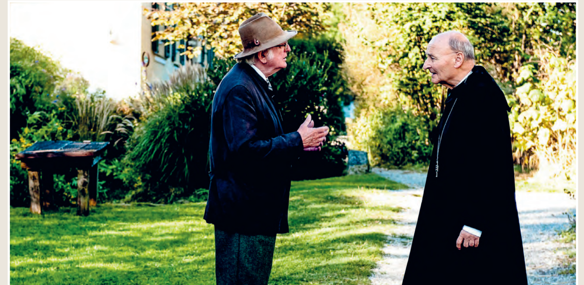
Sonderausgabe zur Ausstellung „Wir sind Schöpfung“